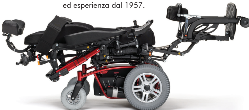
3 posizioni possibili: verticale, seduto o sdraiato

Tutti i tipi di carrozzina possono essere adattati, hanno numerose opzioni e possono essere completamente personalizzati in modo che ci sia un modello per ogni persona. Questo è il risultato della nostra continua ricerca ed esperienza dal 1957.