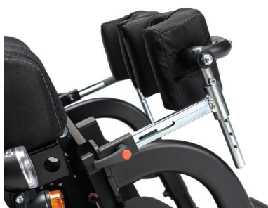
Protezione imbottita per ginocchia