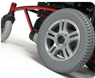
Ruote anteriori 200x50