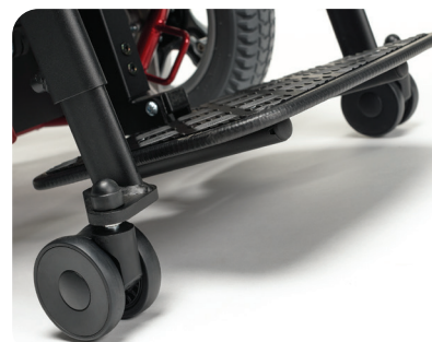
Ruotine anteriori per maggiore stabilità durante la funzione standing