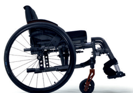
C86 Grigio carbon

Cogli l'opportunità di scegliere tra una varietà di tonalità, personalizzando la tua carrozzina in modo che rappresenti la tua unicità.