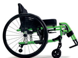
C85 Verde brillante